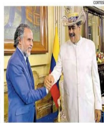
Armando Benedetti saluda a Nicolás Maduro.

Recordemos además que el nombramiento de una nueva cúpula de la fuerza pública provocó la salida de varios altos oficiales, lo que generó malestar en varios sectores. Para el académico, otro de los enfoques en esta “seguridad humana” es el giro en la lógica de la guerra contra las drogas. Pues se combinan