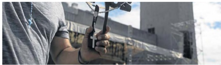
Monseñor Álvarez fue sacado por la policía de su casa pastoral