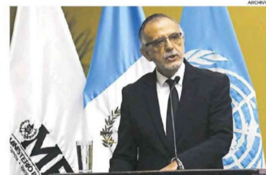
El exmagistrado Iván Velásquez, designado como nuevo ministro de Defensa.

Por Redacción Política BOGOTÁ. Con la designación por parte del presidente electo, Gustavo Petro, del nuevo ministro de Defensa, Iván Velásquez, recordado como el investigador de la parapolítica,