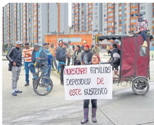
Aquí se vio una resolución por parte de la Alcaldía que erradicó su circulación.